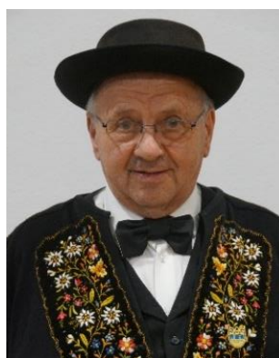
Gut Franz Erstfeld